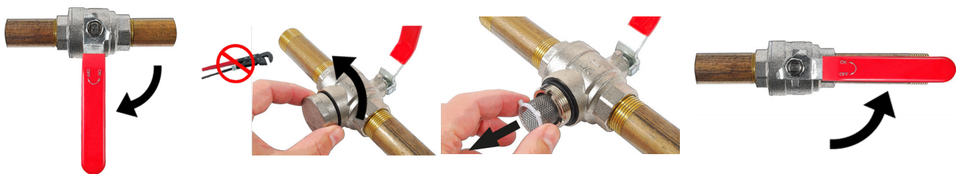
Obr. 6 - uzatvorený ventil