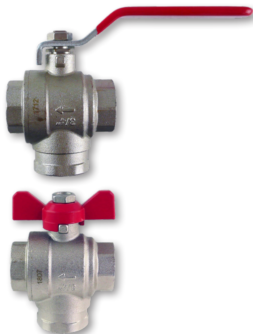
GV s filtrom a magnetom

Návod na inštaláciu a údržbu Gul'ový ventil s filtrom a magnetom